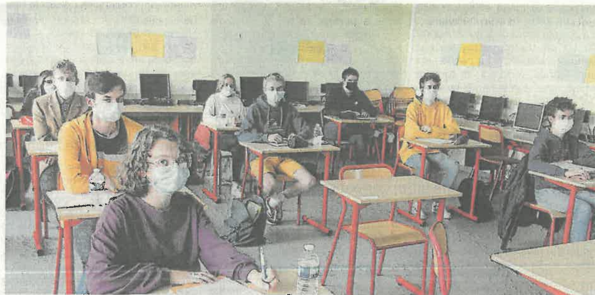
Au lycée Leverrier, 140 élèves de première sur les près de 250 ont repris le chemin des cours.

Après avoir formé les enseignants aux gestes barrières, l'infirmière, Élo-